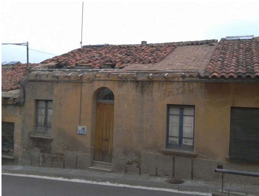
Estat nefast de la teulada de la casa del carrer Costa del Ter (principis de 2016).