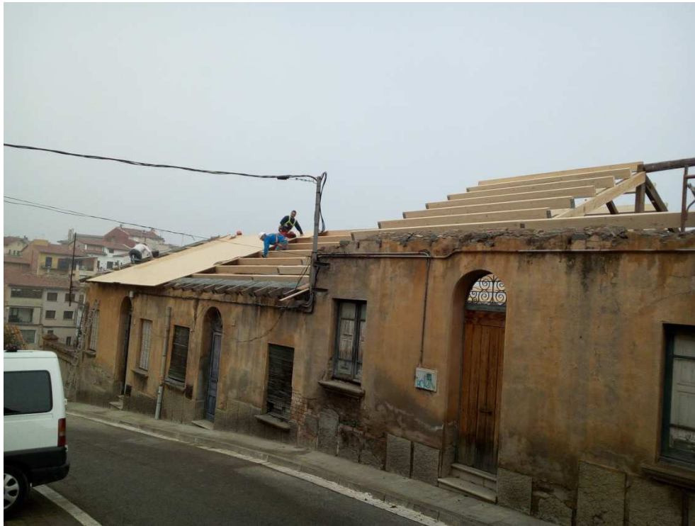
Construcció de la teulada de les cases del carrer Costa del Ter (2016).